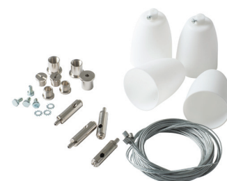
Lisätarvikkeena ripustussarjat 4107113 ja 4146595.